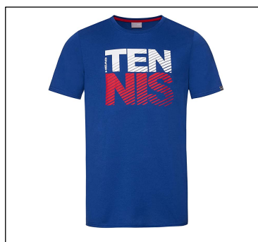
CAMISETA NO REGLAMENTARIA