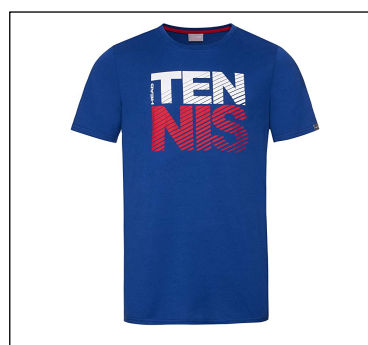
CAMISETA NO REGLAMENTARIA